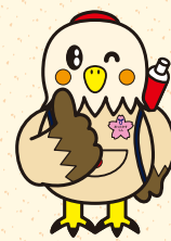
鷹栖町マスコットキャラクター あったかすくん