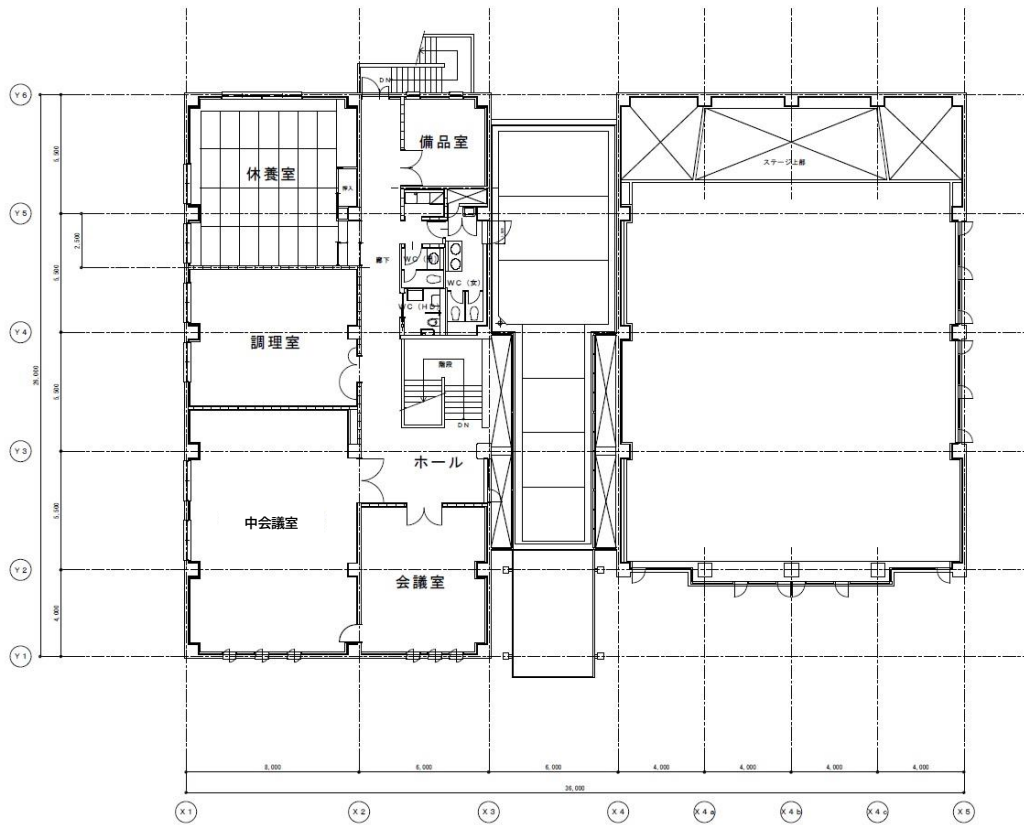
北野地区住民センター 2階平面図