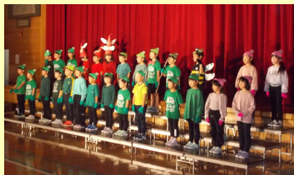
「アひきのかえるの のどじまん」

19日(土) テーマ「みんなが主役～協力して、笑顔で楽しい最高の学芸会」のもと、第126回学芸会を開催しました。これまでの練習の成果を発揮し、一人一人が輝く姿を来賓、保護者の皆様にご覧いただくことができました。大きな行事を通して、また、一步成長した子どもたち。毎日の学校生活でも、身に付けた力を更に高めていけるよう教職員一同、力を合わせて関わっていきます。