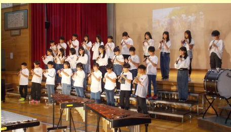
「BELIEVE ～気持ちをあわせて～」