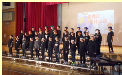
「にん・ニン・忍者」