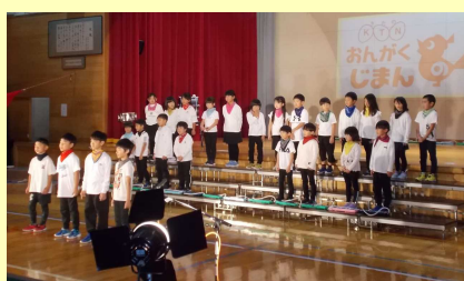
「北野 おんがく じまん」