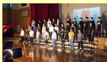
「この地球(ほし)に生まれて」