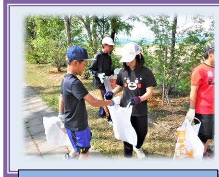
スクールボランティア活動