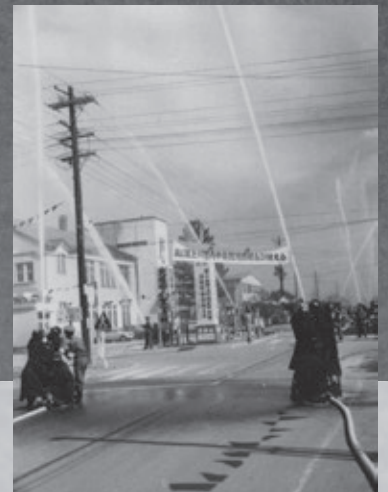
昭和3年 北斗消防演習