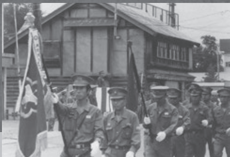
昭和60年 消防演習分列行進