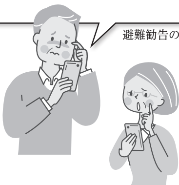
避難勧告の伝達文例