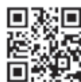
▲防災タイムライン

皆さんの安全を守るためにも、ぜひこのアプリを活用して、災害時の備えをしっかりと整えましょう。