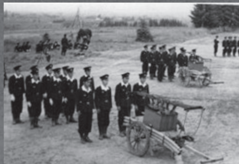
昭和33年 消防大会(旧中央小学校)