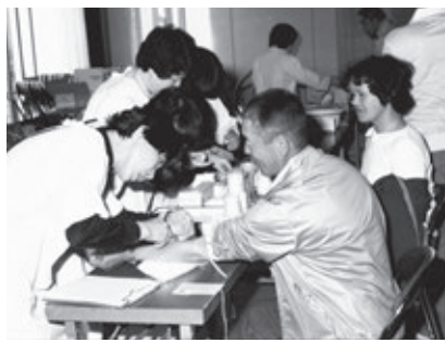
総合健康診査の様子

ら冬の運動不足を補う目的で「歩くスキーフェスティバル」が、昭和60年からは「健康をさがそう」をテーマに「ジョギングフェスティバル」が始まりました。健康に対する意識の高揚は、さまざまな健康づくりの活動へと広がっていきま