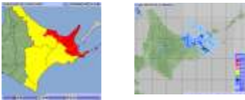
～雨の強さと災害の発生状況～