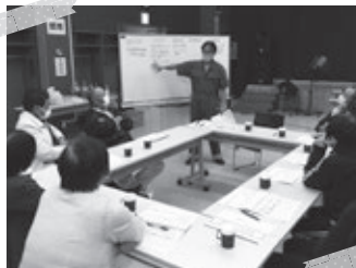
▲北斗地区・モデル地区会議