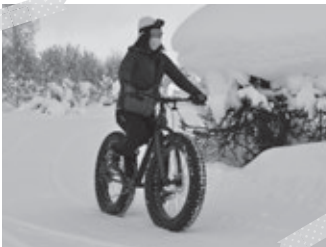
▲雪道でも乗れるファットバイク