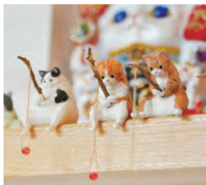
▲カウンター席では猫が釣りをしています。

ラーメンなども並び、とても多彩です。 バリアフリーにより来店への障壁がなく、猫への愛があふれている「バリアフリーキッチン ミックとジム」。そのこだわりの味をぜひご賞味ください。