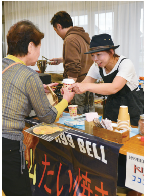
▲6月17日に北斗地区で開催されたイベントの様子