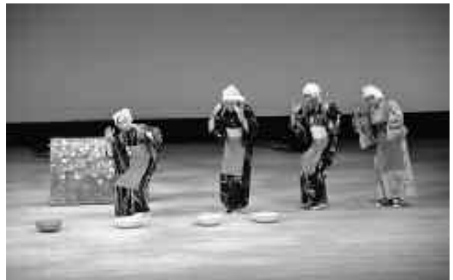
▲鷹栖老人大学の作品「童謡メドレー」

作品には独創的な脚本も多く、恋愛や人間関係を描いたもの、笑いを誘うコント仕立ての作品などに、会場からは大きな拍手が送られました。観客の投票で決まる「銀のトマト賞」を鷹栖老人大学が受賞したほか、「金のトマト賞」1組、「銅のトマト賞」3組が表彰されました。