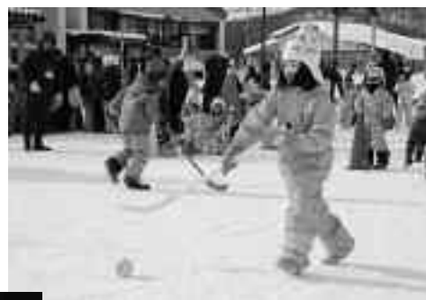
北の文化祭雪中運動会