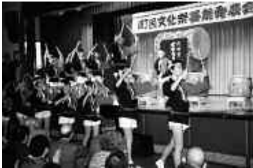
平成元年の町民文化祭の様子