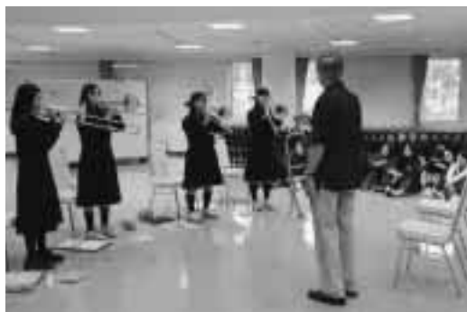
ベルリンフィルから指導を受ける鷹栖中吹奏楽部員