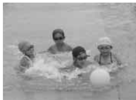
水中運動会「アクアキッズフェス2007」