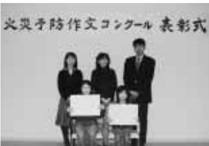
火災予防作文コンクール表彰式

昨年の10月30日、上川支庁で全道火災予防作文コンクールの表彰式が行われました。火災予防作文コンクールとは、児童を通じて学校および家庭の火災予防思想の普及啓発を図るものとして、各小学校の4～6年生の児童を対象に行っています。