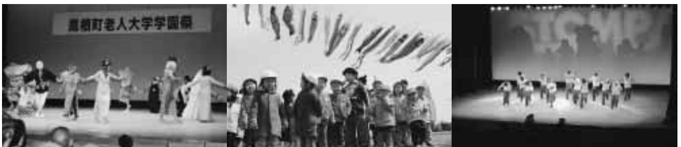
( )は2008年内に迎える満年齢。

皆さんにとって、2007年はどんな1年になりましたか。 たくさんの方が参加するお馴染みのビッグイベントや 昨年が初開催の行事、明るい話題などを中心に1年を振り返り、 今年の干支にちなんで子（ねずみ）年生まれの皆さんに、 2008年の抱負を述べていただきました。