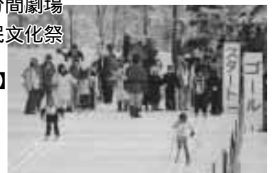
たかすオオカミの里北野クロスカントリー大会