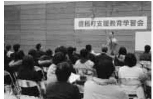
1月25日「第2回支援教育学習会」の様子

平成19年4月から、全国で一斉にスタートした「特別支援教育」。町内では平成18年5月に「特別支援教育推進委員会」を設立し、身近な地域において特別な支援を必要とする子どもの自立や社会参加を目指し、準備を進めてきました。