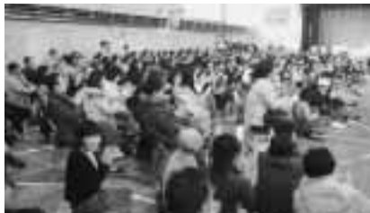
第6回柏の里ふれあいコンサート