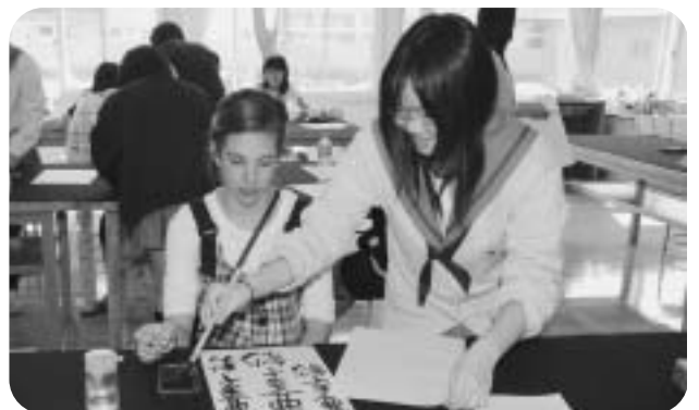
鷹栖高校で書道体験

最終日のお別れ会では、受け入れ家族たちと涙の抱擁を交わし、再会を誓い合っていました。