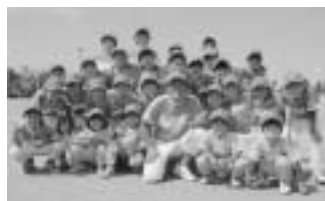
もう一つの家族 鷹栖野球少年団の子どもたち