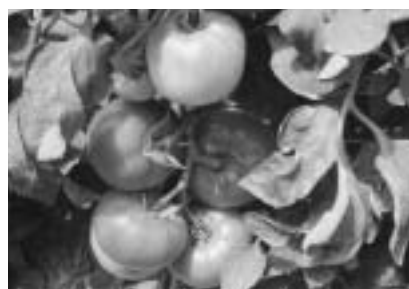
ジュースだけでなく、生食用トマトも今が食べごろです。

収穫直前まで、太陽と土の恵みを最大限まで蓄え続ける高品質の完熟トマトを安定的に出荷するために、生産者は収穫と管理に大忙しの毎日です。