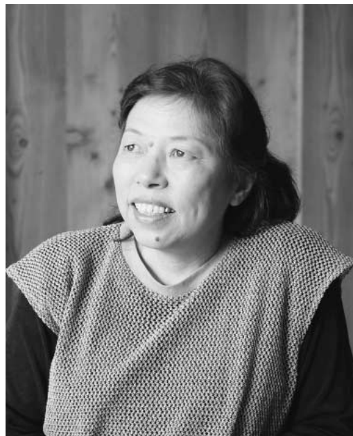
鷹栖町民書道教室 代表 書究文化書芸院硯友支部