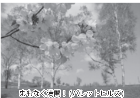
まもなく満開！（パレットヒルズ）

水道は、パレットヒルズのすぐ下まで来ていますので最小限の予算でできます。公園で楽しむ観光客を考えると、水道料に換算できない効果があると判断しています。