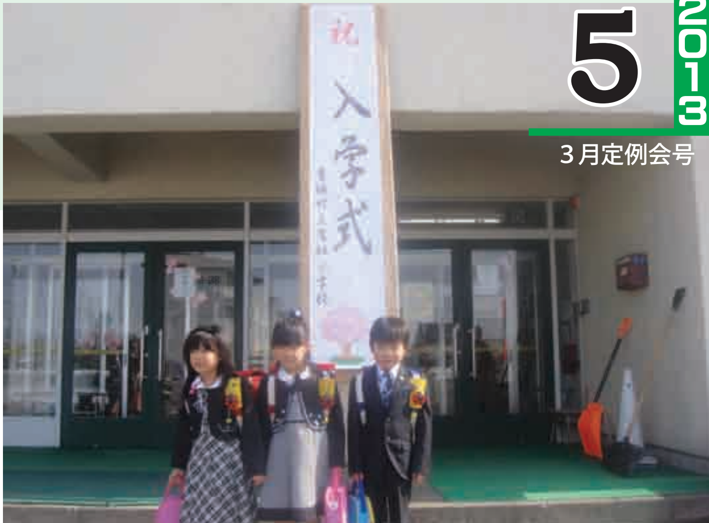
ピカピカの一年生(三つ子ちゃん)