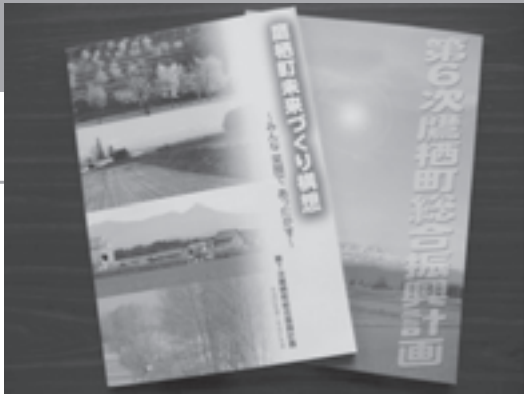
第6・7次鷹栖町総合振興計画

質問 第7次鷹栖町総合振興計画について、現時点での評価及び今後の対応について伺います。