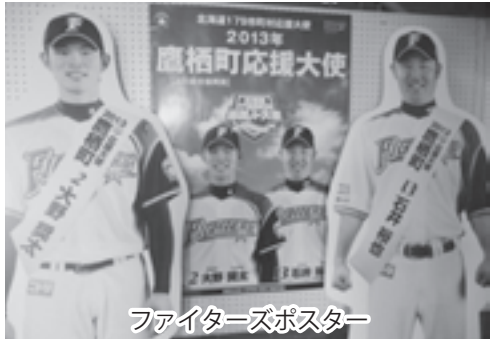
ファイターズポスター