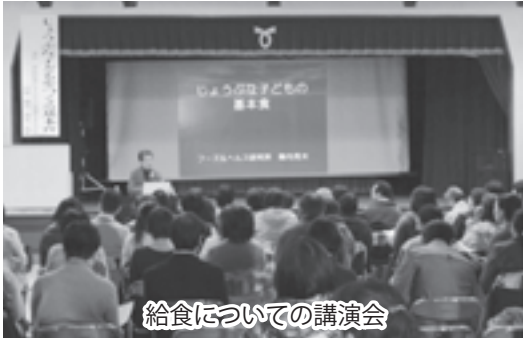
給食についての講演会