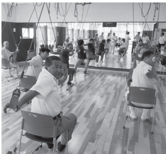
レッドコードの体験

町民が元気でいられることは、介護保険の費用を抑えるばかりでなく、明るい町づくりの大きな力といえます。