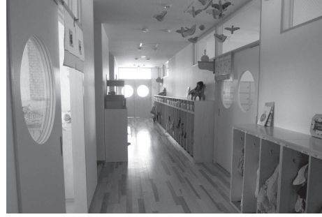
増築された認定こども園

4月より、幼稚園に保育園の機能を併せた認定こども園になりました。1歳から登園でき、働く保護者は安心して預けられます。総額約1億2300万円のうち、町は約2500万円を補助、5月現在、3歳未満児18名を含む146名を受入れています。乳幼児と保護者の遊び・相談・交流の場として子育て支援室も整備されています。鷹栖町の将来を担う子どもたちが元気に育つことを願っています。