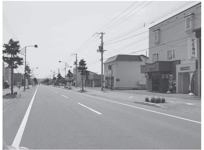
鷹栖地区商店街の様子

人 口減少対策、働く場所の確保策として、色々な支援が行われているが、地域経済の回復が感じられない。 旭川市などへの購買力の流出による売り上げ減少、経営者の高齢化や後継者がいないことによる休廃業での空き店舗の増加、深刻な労働力不足による事業の断念など危機的な状況にある。 各種助成事業の利用状況と、さらなる中小企業支援策への考えは。