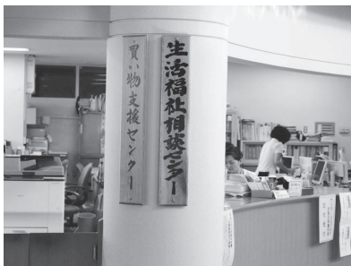
サンホールはびねすにある「生活福祉相談センター」

町では、平成26年から「生活福祉相談センター」を設置し、社会福祉士を配置しています。さまざまな困り事に対して、ワンストップにより相談に応じています。