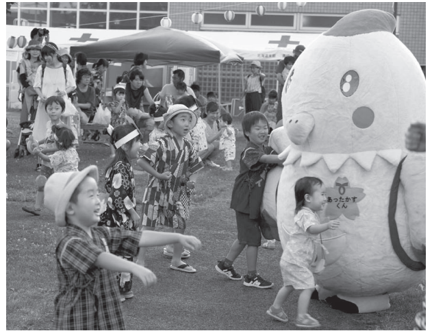
子育て支援センターで開催された「夕涼み会」の様子

出生数と、「子ども・子育て支援事業計画」で予測していた0歳児の数には大きな開きがある。計画の見直しが必要では。